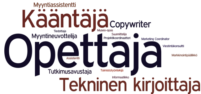
Kuvio 2. Kieliasiantuntijoiden ammattinimikkeet ensimmäisessä työpaikassa.

giasta valmistunutta. Huomionarvoista on, että kaikki tekniset kirjoittajat ovat englantilaisen filologian alumneja. Aineiston perusteella moni on aloittanut työuransa kääntäjänä, vaikka Oulun yliopistossa ei varsinaisesti kääntäjäkoulutusta olekaan. Suurin osa kaikista kieliasiantuntija-ryhmän vastaajista on työllistynyt elinkeinoelämän palvelukseen.