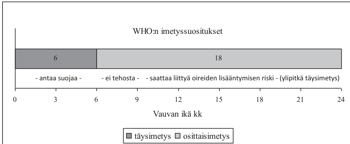
Kuvio 1. WHO:n imetyssuositukset ja Pesosen (2008) väitöstudkimuksen tulokset yli-pitkän täysimetyksen suojasta allergioita vastaan.

Kuten edellä totesin, WHO suosittaa 6 kuukauden täysimetystä, ja sen jälkeen imetystä, ts. osittaisimetystä, jatkettavaksi muun ruuan ohella ainakin 2 vuoden ikään (Loppi 2004). Kuvio 1 havainnollistaa WHO:n imetyssuosituksia ja väitöstudkimuksen tuloksia yli puoli vuotta kestävästä täysimetyksen suojasta allergioita vastaan.